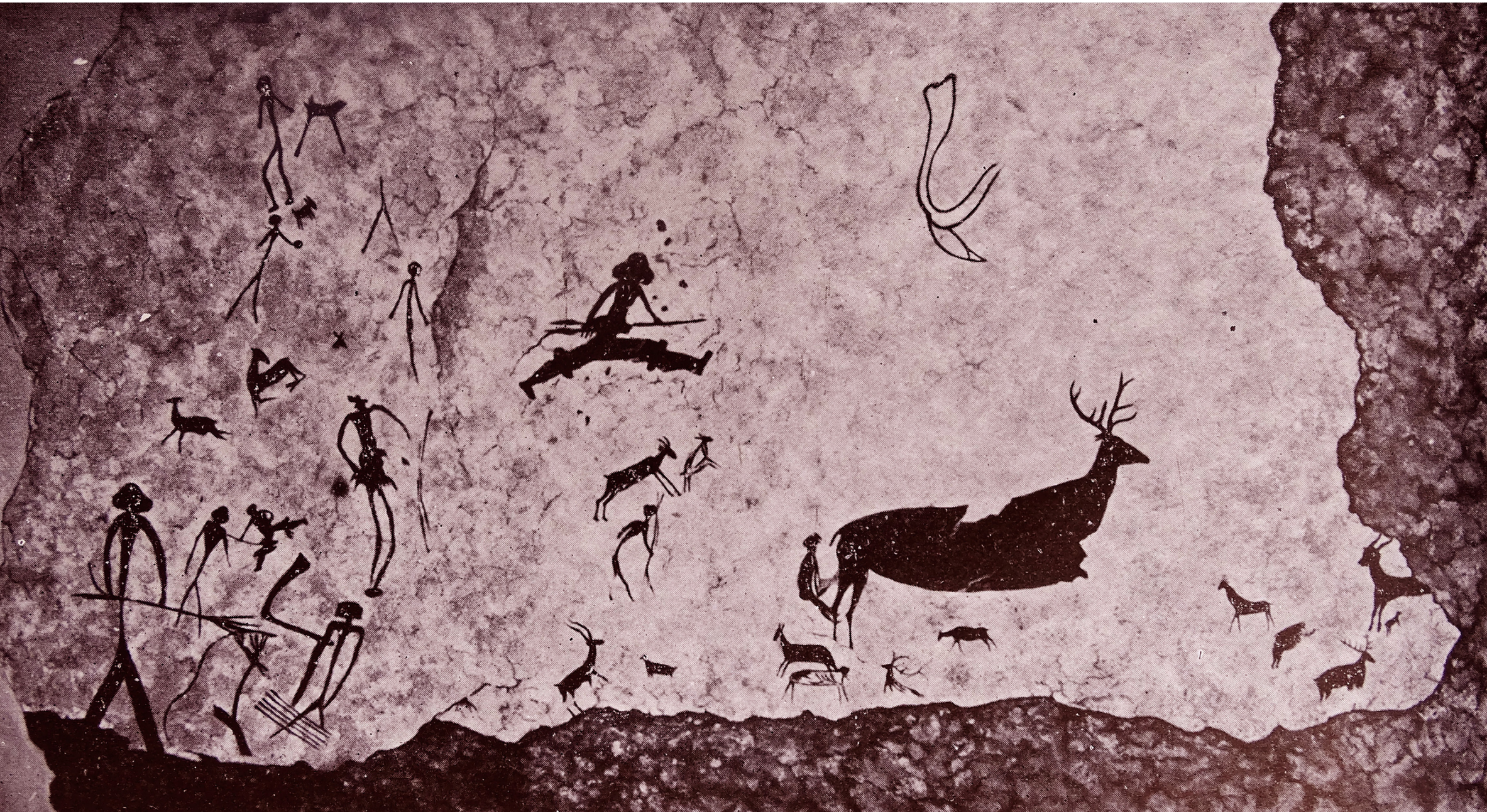
Palæolitisk hulemaleri i Altamira, Spanien. 13.000 f.Kr.